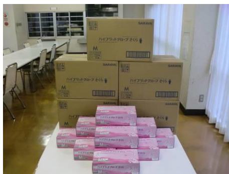
ハイブリッドグローブ