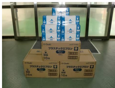
プラスチックガウン